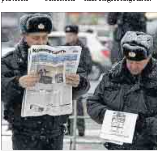
Sie können in den Zeitungen alles über Putin lesen, kaum etwas über die Opposition: Polizisten in Moskau.

dürften. Im Vorfeld wurden Oppositionelle massiv eingeschüchert, zum Teil verhaftet und ihr Wahlmaterial tonnenweise beschlagnahmt. Sergej Mitrochin von der westorientierten SPS: „Das war der dreckigste Wahlkampf, den wir je hatten!“