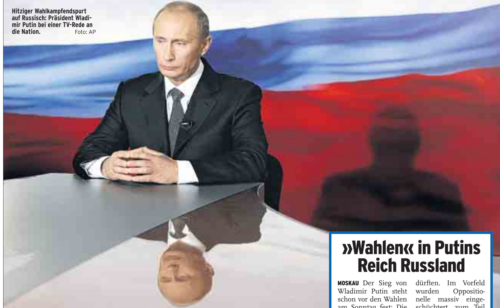
Hitziger Wahlkampfendspurt auf Russisch: Präsident Wladimir Putin bei einer TV-Rede an die Nation.